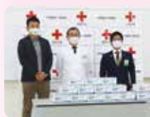
飯田青年会議所様より