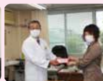
松川町役場様より