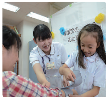
看護師体験では、お母さんの血圧を測ってみました。