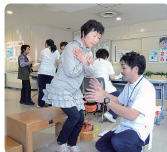
足腰の丈夫さを測るロコモ度チェック。リハビリスタッフが丁寧にアドバイス。