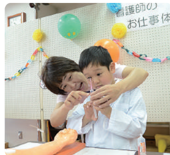
注射をする前には十分に空気を抜いて、丁寧に刺してくださいね!