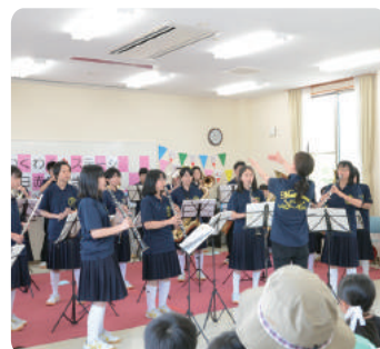
松川中学校吹奏楽部のみなさんの本格的な演奏は圧巻でした!