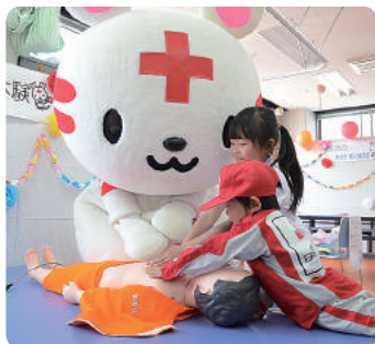
今年初めての心肺蘇生体験。「ハートラちゃん」と協力して助けるぞ!

その他にも、無料検診やロコモ度チェック、献血、軽食の販売、フリーマーケットなど、例年にも増して大盛況となりました。