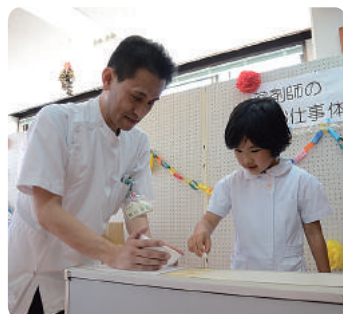
ラムネを使った調剤体験。お薬は多くても少なくともいいませんよ～。