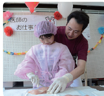
手術体験。本物のメスと針で切開・縫合しました。緊張しちゃうね。