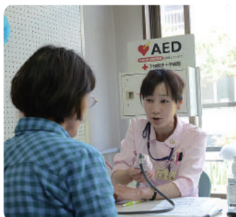
今年も看護師による健康相談や無料検査は大人気でした!